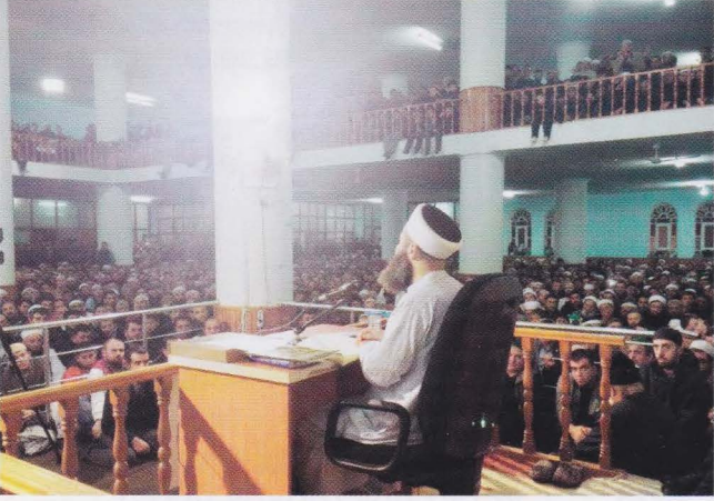
Bursa Külliyesindeki Sohbetten..