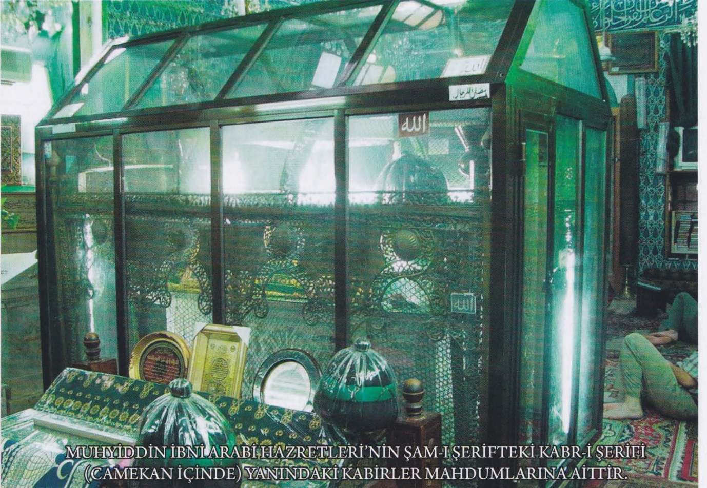
MUHYİDDİN İBNİ ARABİ HAZRETLERİ'NİN ŞAM-I ŞERİFTEKİ KABR-İ ŞERİFİ (CAMEKAN İÇİNDE) YANINDAKİ KABİRLER MAHDUMLARINA AİTTİR.

Bu makalede bir çok muasır alim tarafından "imam" kabul edilen ve mezhepler arası icmaya aykırı konularda görüşleri tercih edilen İbn