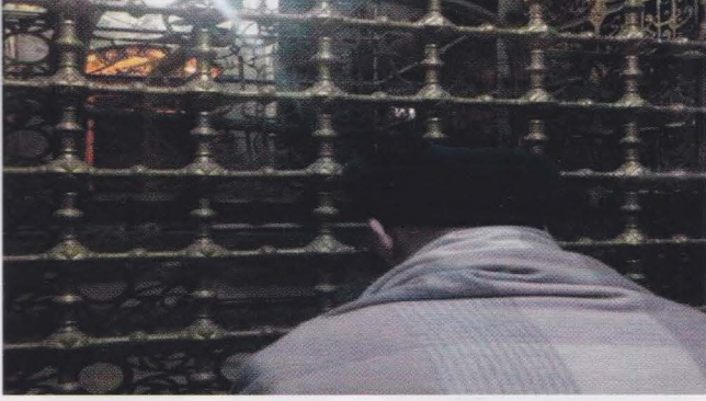
Ebû Eyyûb el-Ensârî (Radyallahu Anh)